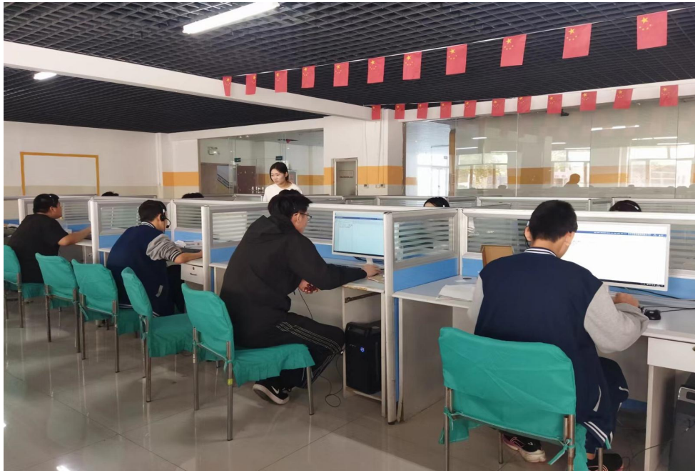
图 7： 计算机实操课